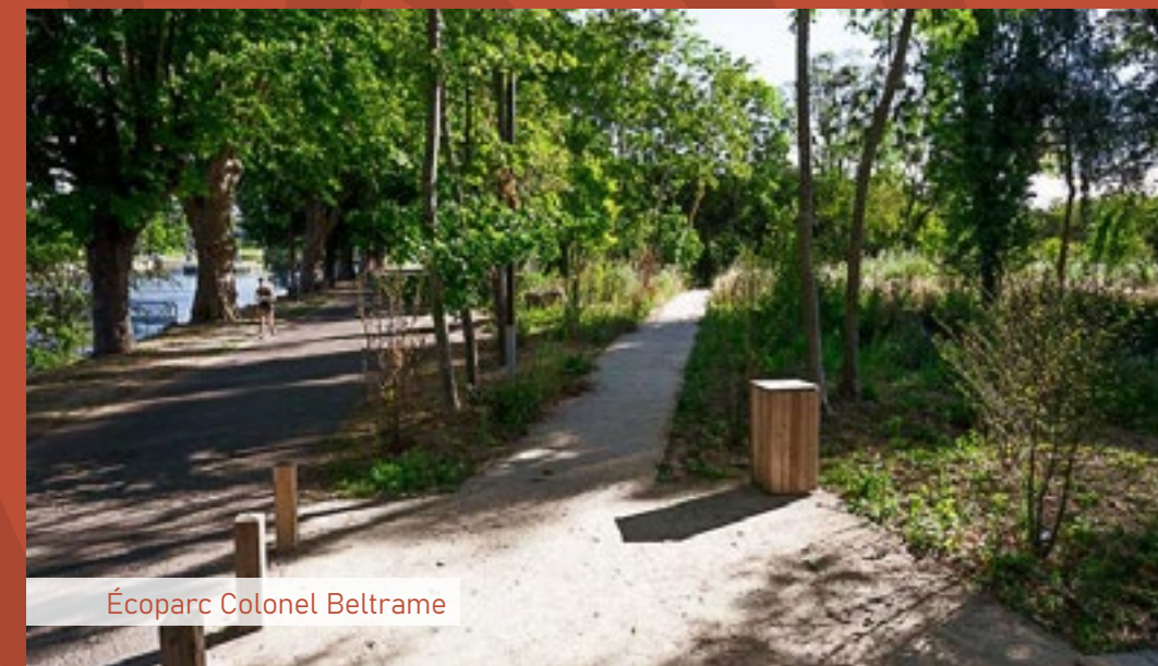
Écoparc Colonel Beltrame

Enfin, une future place qui verra le jour entourée de commerces et d'un restaurant qui seront propices aux échanges et à la détente avec l'organisation d'événements festifs et conviviaux en plein-air.