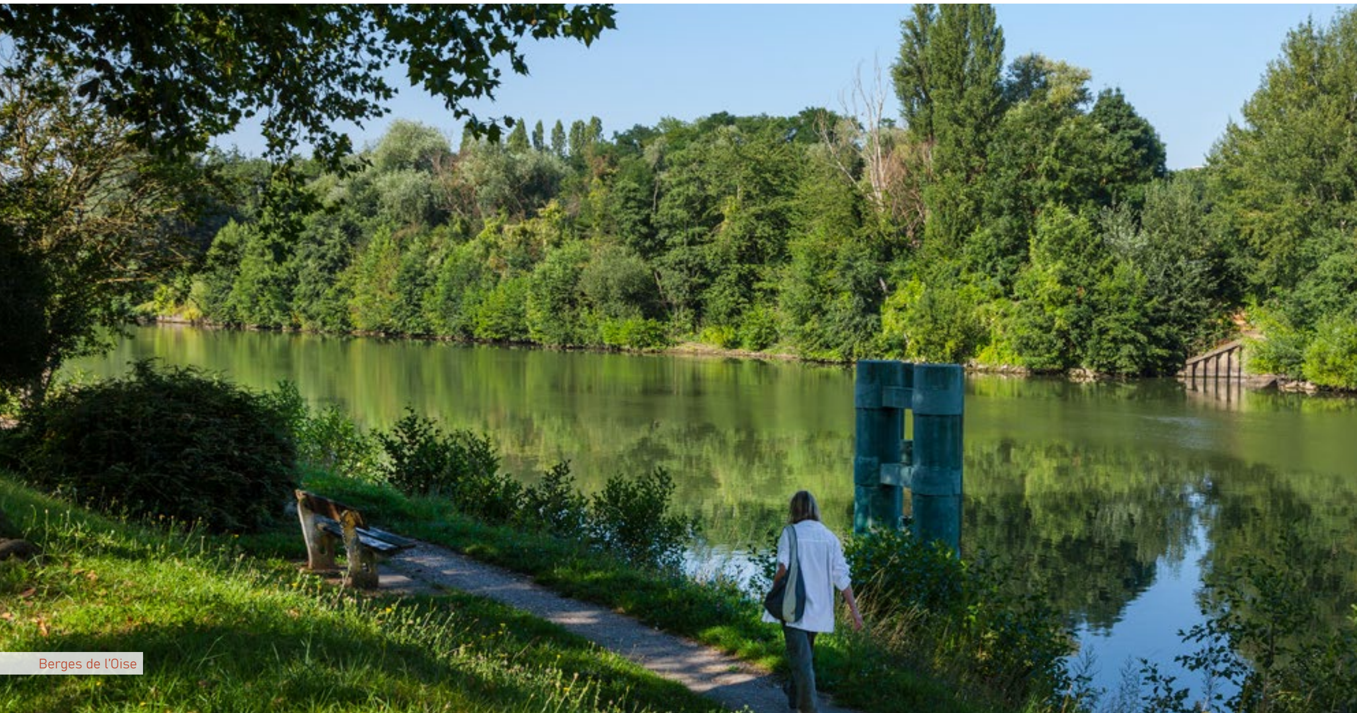
Berges de l'Oise

Au sein de l'agglomération nouvelle de Cergy-Pontoise, Éragny-sur-Oise profite enfin d'une belle dynamique et de la proximité d'infrastructures telles que l'université et l'Île de loisirs de Cergy-Pontoise.