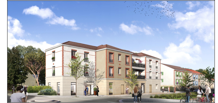
Bâtiment A1, 2eme Etage